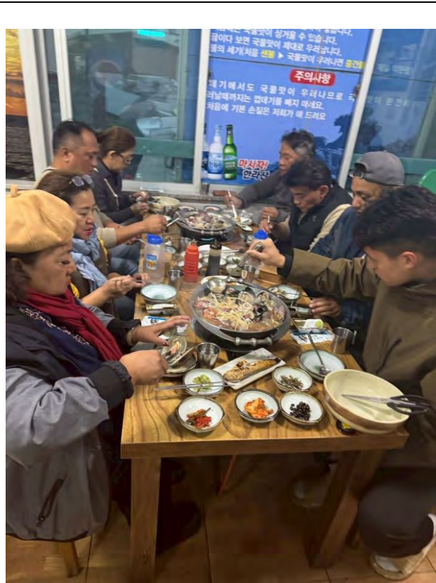
體驗在地-料理美食