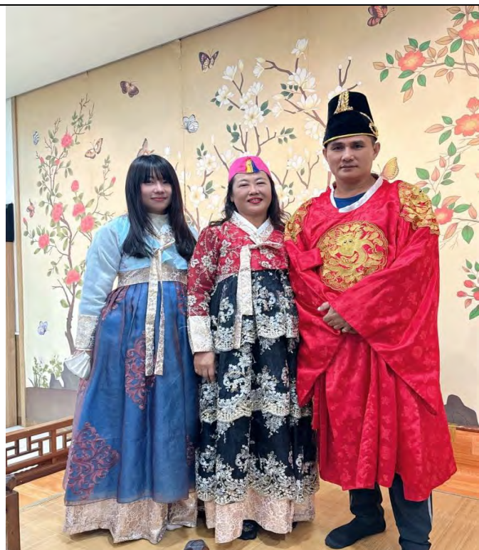
深入當地傳統-體驗韓服