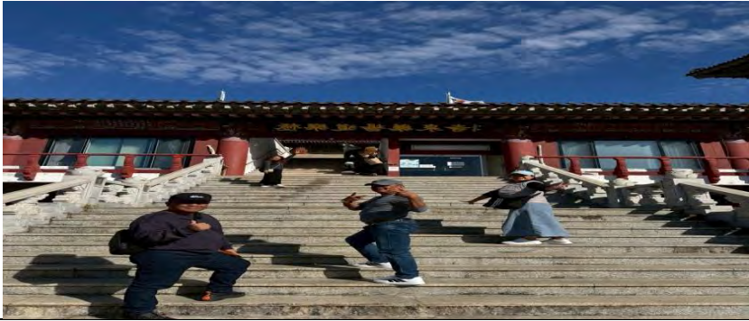
濟州最大的寺廟-藥泉寺