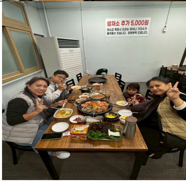
體驗在地-料理美食