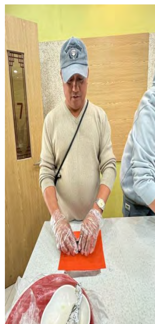
深入當地傳統料理---製作海苔飯糰