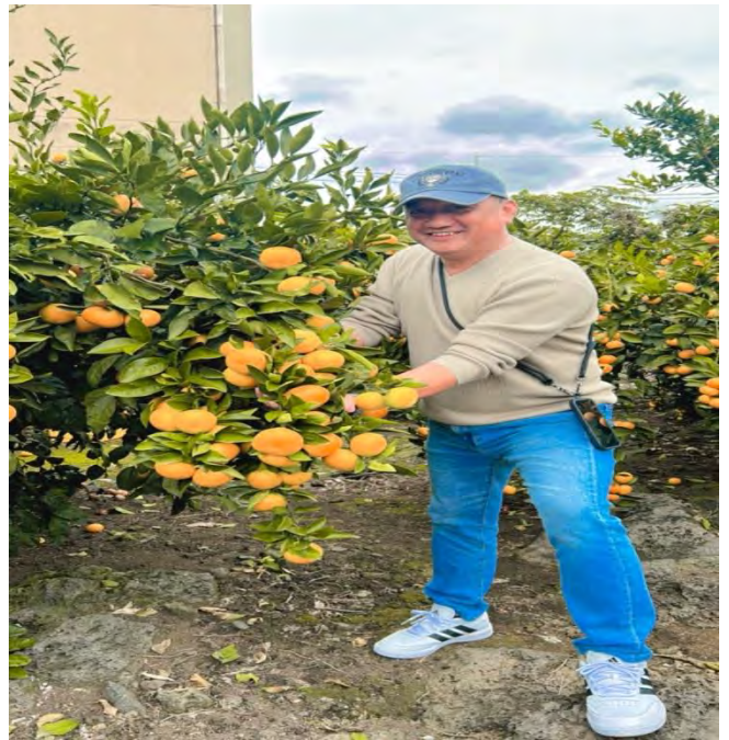
濟州桔園-體驗採果樂