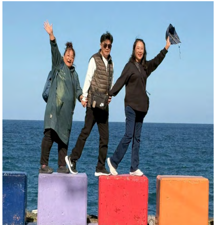
道頭峰彩虹海岸路